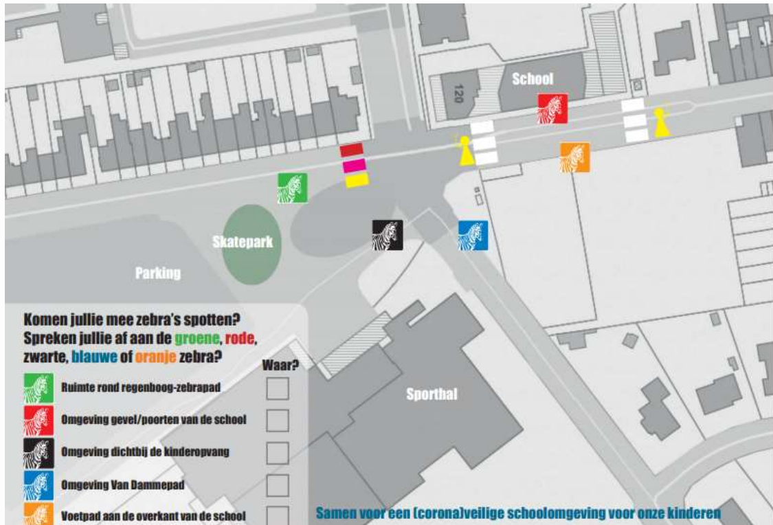
Afbeelding met dank aan de ouderraad, werkgroep verkeersveiligheid naar aanleiding van de actie 'gelukszebra's'.